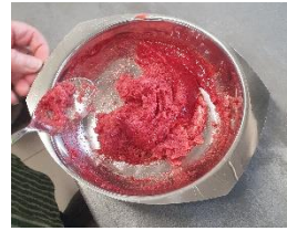
Foto: Beerensalz ist ein echter Hingucker auf Kräuterquark oder Salaten – dazu wird Beerenmus mit Kochsalz gemischt, anschließend muss die Masse nur noch getrocknet und im Sieb gegeben werden.

Mittlerweile geht es auch etwas exotischer – vor allem die Zubereitung von Chutneys muss hier erwähnt werden. Bei dieser Gelegenheit wurde bereits die nächste gemeinsame Veranstaltung für den Herbst geplant.